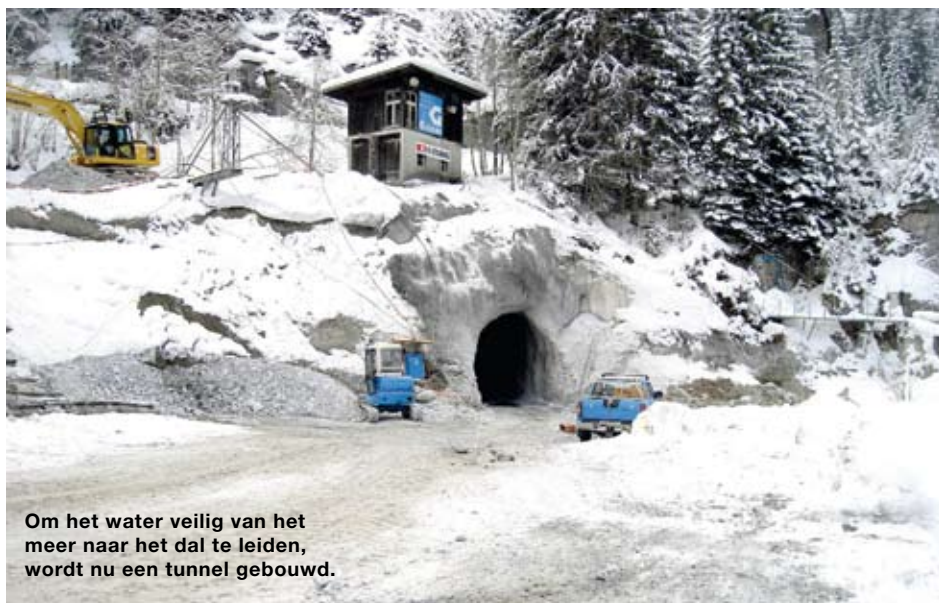
Om het water veilig van het meer naar het dal te leiden, wordt nu een tunnel gebouwd.

Het laatste deel van de tunnel voert door een laag puin naar de kunstmatige overloop. Die wordt zo aangelegd dat het meer voortaan maximaal 500.000 m 3 kan bevatten, een hoeveelheid die bij een eventuele uitbraak makkelijk kan worden opgevangen. Het meer wordt in de loop van de jaren echter steeds dieper, waardoor het aansluitpunt iedere drie tot vijf jaar moet worden verlaagd. Tegen de lente van 2010 moet de rust terugkeren in het dal, en kunnen ook de inwoners weer rustig slapen. ●